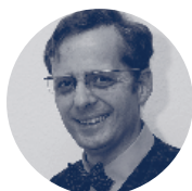
Bernd Anstadt Richter a. AG (waR), Amtsgericht Karlsruhe